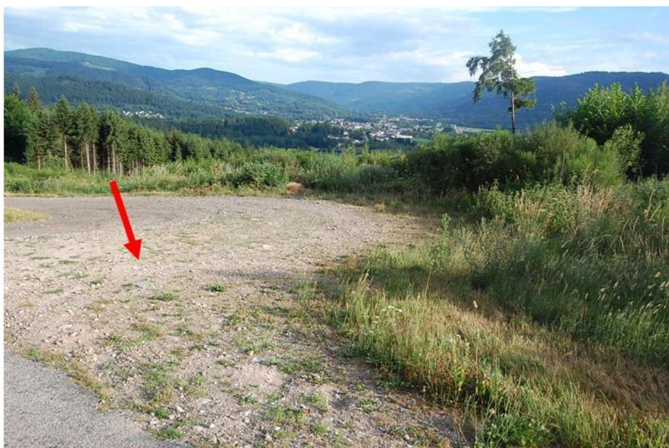
Emplacement de la Jeep au bord de la route de Chèvre-Roche en face des ruines de la ferme de L'Erclos

Avant d'être définitivement retiré du service, le capitaine MUSTAIN a échappé à de nombreuses embuches. Alors qu'une rafale d'obus de mortier venait de frapper leur position tuant 5 hommes, le capitaine Mustain continua avec calme à amputer la jambe d'un soldat blessé en utilisant son couteau de chasse. Il affirma qu'il ne fallait pas perdre son sang-froid alors que les effets d'une guerre se situaient tout autour de vous.